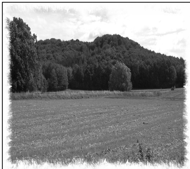
Obr. č. 2 Pohled od Řitonic na kopec Žlunov

Nejasnost č. 2 – Na snímku je pohled od Řitonic (Obr. č. 2) na zalesněný kopec Žlunov, kde původně stávala tvrz, o které nám historik A. Sedláček zanechal stručnou zprávu: „Severovýchodně od Domousnic, mezi vesnicemi Veselicí a Řitonicemi na kraji lesa Žlunova se spatřovalo na počátku 19. století tvrzíště, o jehož osudech nic známo není. Možná tu prvotně