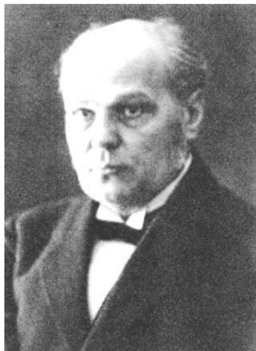
Obr. 1. Antonín Švehla 1. předseda agrární strany.

V roce 1906 byl spoluzakladatelem časopisu Venkov; v roce 1907 byl zakladatelem Rolnické tiskárny; v letech 1908 – 1913 byl poslancem českého zemského sněmu; v letech 1914 – 1918 byl vůdčím představitelem domácího odboje, Mafie, proti Rakousku – Uhersku. V roce 1916 se podílel na založení Národního výboru, který se stal představitelem odboje v Čechách. Stal se jeho jednatelem. V prvním období války zastával umírněně oportunní postoj, brzdící otevřený protirakouský aktivismus části českých politiků. V době vězení Karla Kramáře byl hlavou české politické reprezentace. Stál v pozadí za vstupním prohlášením Českého svazu Říšské radě